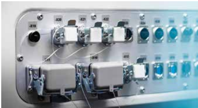
Unterseite der SCB

Die neue Scanner-Steuerungsbox ist kompatibel mit allen Blackbird-Software-Paketen (2D-Basis, 3D-Static, 3D-OTF) sowie der Blackbird-Kameralösung ScaVis als separate Zusatzoption. Der leistungsstarke Prozessor der SCB ermöglicht eine schnelle Datenverarbeitung und Programmbearbeitung für eine effiziente System-Performance.