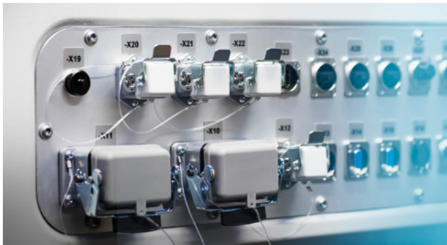
Unterseite der SCB

Die neue ScannerControlBox ist kompatibel mit allen Blackbird-Software-Paketen (2D-Basic, 3D-Static, 3D-OTF) sowie der Blackbird-Kameralösung ScaVis als separate Zusatzoption. Der leistungsstarke Prozessor der SCB ermöglicht eine schnelle Datenverarbeitung und Programmbearbeitung für eine effiziente System-Performance.